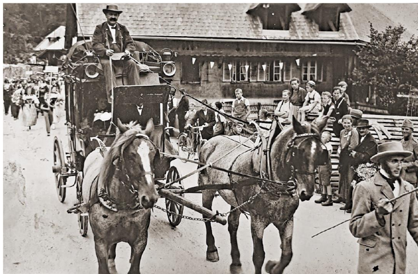
Musikfest 1934 in Eggwil – Umzug mit der alten Postkutsche von Eggwil

Weitere Sponsoringbeiträge für das EGGIWIL-BUCH auf unser Konto bei der Valiant Bank in Eggwil (IBAN CH13 0630 0506 5752 6368 8, lautend auf IG Heimatbuch Eggwil, 3537 Eggwil) sind nach wie vor sehr willkommen.