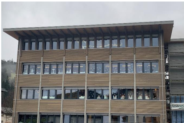
Unser Schulhaus Dorf in neuem Kleid

Ein neues Kalenderjahr hat begonnen – im aktuellen Schuljahr sind wir mittendrin. Wir hoffen, dass Sie einen angenehmen Jahreswechsel hatten und wünschen Ihnen allen ein gefreutes und spannendes 2024!