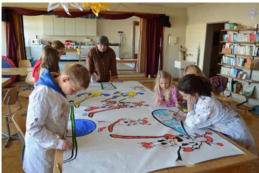
gefleckte Eishockeymannschaft auf das Plakat zu malen.

Eggiwil: Die Gesamtschule Chapf gestaltet ein Plakat für den Swissmilk-Wettbewerb «Milch macht fit». An Freude und Elan mangelt es nicht, um zu gewinnen braucht es aber auch Glück.